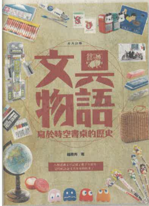
▲生活及科普類最佳出版獎：《文具物語——寫於時空書桌的歷史》

個人的成長路上，總有不少文具陪伴身邊，文具的歷史源遠流長。今屆生活及科普類最佳出版獎得主《文具物語——寫於時空書桌的歷史》由上世紀香港淪陷時期說起，當時日港，東洋色彩文具湧至；六十年代太空人登陸，文具開始沾上太空風；塑膠工業於戰後發展，深深影響新一代文具製造及設計。一守崗位的文具店，也隨着時代節拍而漸起變遷……香港的文具業發展，將何去何從？