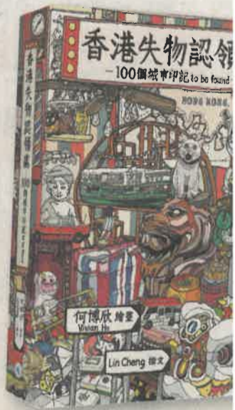
▲圖文書類最佳出版獎、優秀編輯獎：《香港失物認領處——100個城市印記 to be found》/非凡出版

物(如蛋撻、西瓜波、白兔糖等)地區人物故事(包括駐維港的天星街的卡拉OK負責人、大澳的蝦醬廠)希望讀者能細心欣賞畫作，從中找人物，重新認識身邊的人和事，並之處。