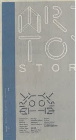
▲圖文書類出版獎、市場策劃獎：《Toy Story (上集)》

獲今屆市場策劃獎及圖文書類 Toy Story (上集) 鉅細無遺地的規模、發展進程及創作藍圖，提供了非常重要的第一手資料。架，首先是要將整個產業內的各介紹，當中包括創作人、廠牌、玩各地玩具展主辦人等，以了解他迹，從而拼貼出整個網絡版圖：單位面對面的深入訪談；最後跨洲，並透過在香港舉行玩具展之展的單位進行密集式採訪，以了展情況。因為透過這樣的對比，港玩具設計師的位置及影響力。