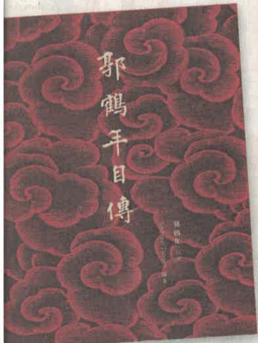
▲商業及管理類最佳出版獎：《郭鶴年自傳》